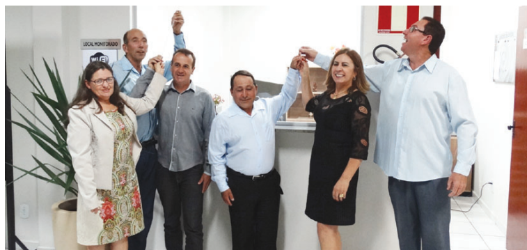
CAC (Centro de Apoio ao Cidadão)