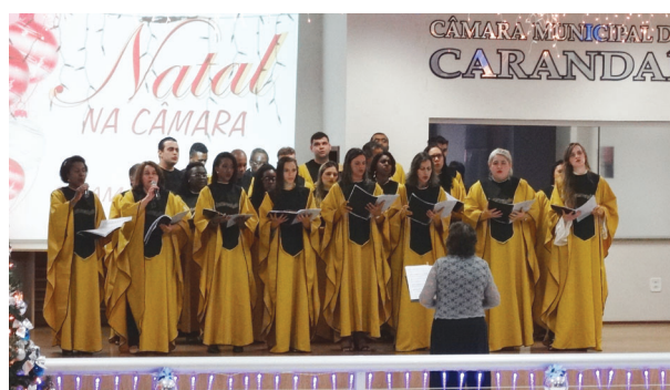
Coral Vozes para Cristo da Igreja Presbiteriana de Carandaí