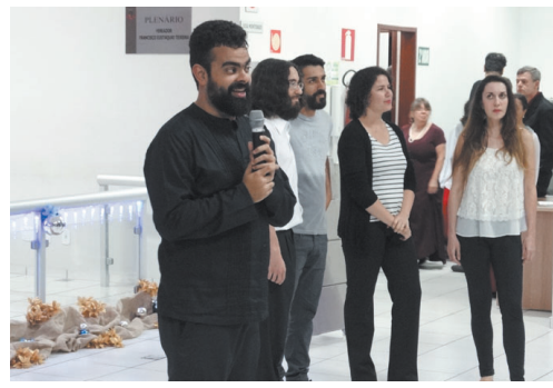
Coral "Coro Novo"