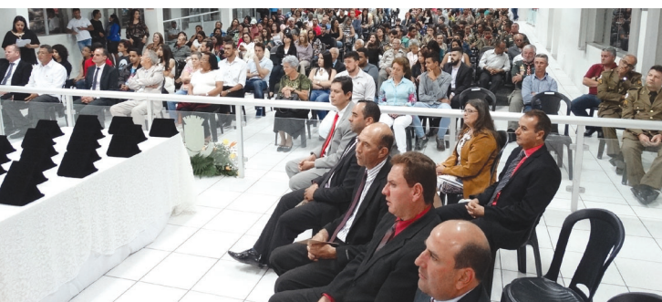
Sessão Solene: Honrarias, aplausos e reconhecimento a todos que se destacaram na construção de uma Carandaí mais bela.