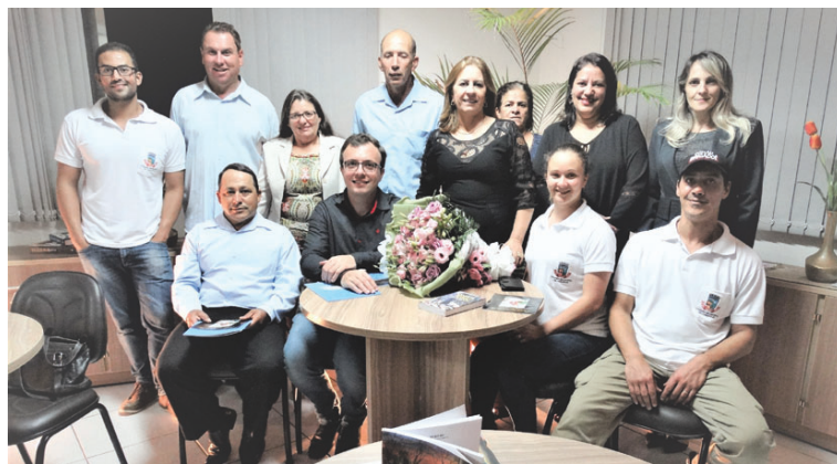
Servidores e vereadores da Câmara