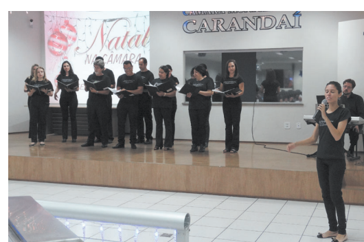
Coral Fio Cantos de Minas de BH