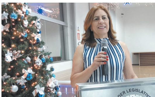
Presidente da Câmara Abertura do Natal da Câmara

Entre os dias 7 a 9 de dezembro, a Câmara Municipal de Carandaí celebrou o Natal com toda a população carandaiense. Apresentações brilhantes danças, corais, bandas e também exposições de pinturas, orquídeas e feiras de artesanatos e doces caseiros. Nossos mais sinceros agradecimentos a todos.