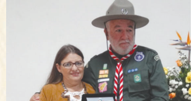
Moção de Aplausos: Grupo de Escoteiros Barão de Santa Cecília