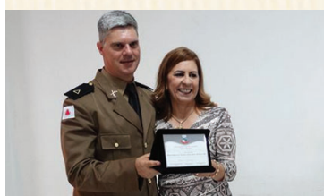
Moção de Aplausos: Banda de Música do 9º Batalhão da Polícia Militar de Barbacena/MG