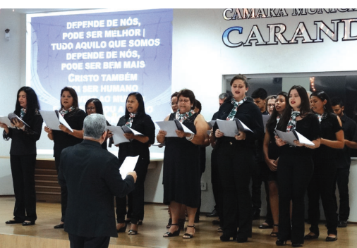
Igreja Presbiteriana de Pedra do Sino