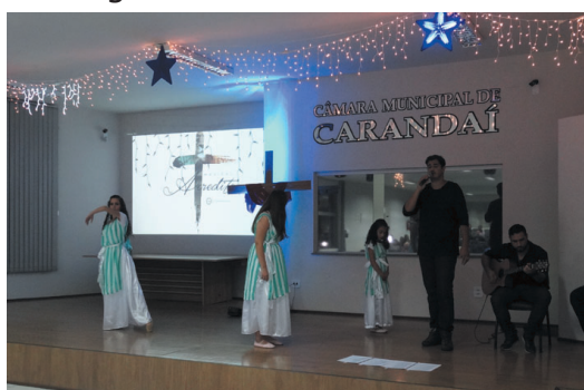
Igreja Batista da Reconciliação