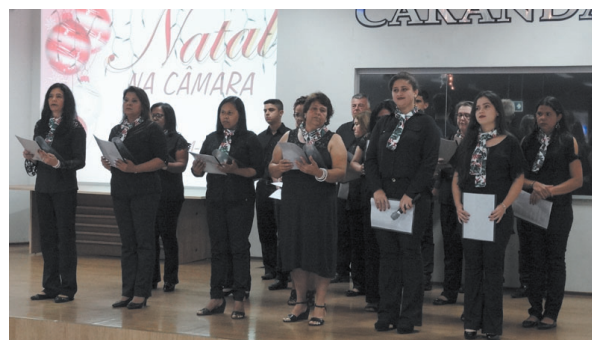
Coral da Igreja Presbiter