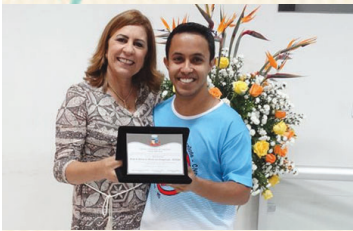
Moção de Aplausos: Grupo de Jovens em Marcha pela Evangelização – JEMPE