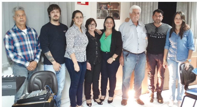
Biblioteca Pública Professora “Marilyny Aparecida Barbosa Silva Rocha”