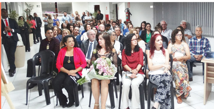
Inaugurações.: A Câmara a serviço do Povo em prol de uma Educação política e garantia de vida digna para todos.