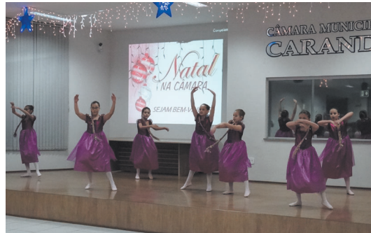
EDA - Acadêmia Espaço da Arte