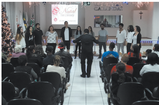
Coral "Coro Novo" (BH)