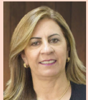
Presidente da Câmara Municipal – Biênio 2017-2018 Legislatura 2017-2020