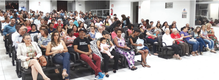
II Semana de cultura da Câmara: Riqueza em conhecimentos e dons. Valorização dos artistas da Terra e região.