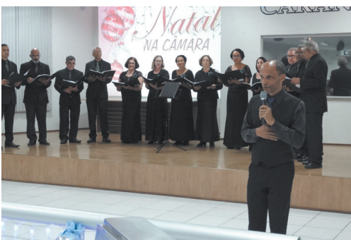
Coral Contas e Cantos do Tribunal de Contas de Minas Gerais (BH)