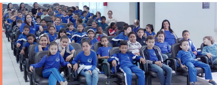
Cine Câmara: A Infância valorizada, diversão e aprendizagem garantida através de sessões de filmes selecionados com muito carinho.