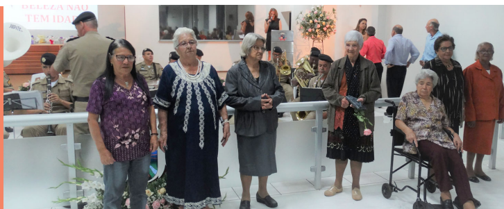
Projeto SER MULHER: A Mulher de 80, histórias de grandes conquistas, superações e muita sabedoria.

CÂMARA EM MOVIMENTO: O Poder Legislativo mais próximo do povo, valorizando e garantindo a todos uma cidadania democrática.