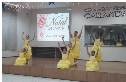
EDA - Acadêmia Espaço da Arte