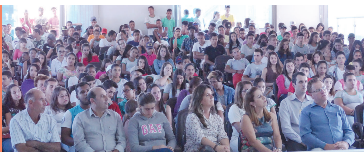
PJ/2017: Parlamento Jovem – 2017: Educação Política para estudantes do Ens. Médio, preparação e formação dos jovens para uma participação política consciente.