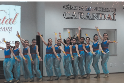
EDA - Acadêmia Espaço da Arte