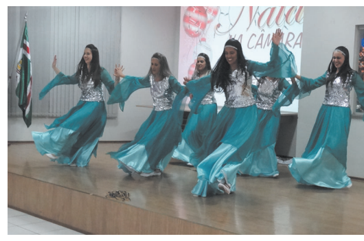
Ministério de Dança Kadosh - Igreja Batista de Carandaí Palavra Viva