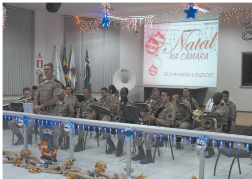
Banda de Música do 9º Batalhão da Polícia Militar de Barbacena