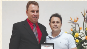
Moção de Aplausos: Carandainet Serviços de Internet Ltda.

A Câmara parabeniza a todos os agraciados.